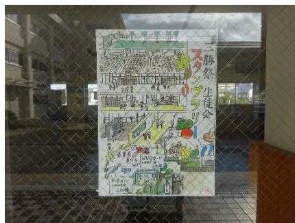
生徒会企画 スタンプラリー ポスター