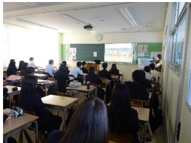
ステージ発表は録画したものを各教室の電子黒板で視聴しました。