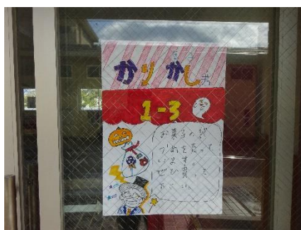
クラス企画の紹介 ポスター