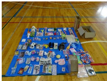
生徒会が企画したスタンプラリー受付の様子と豪華な景品です。