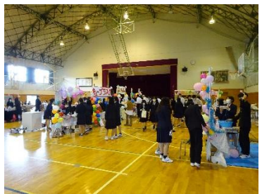
クラス企画はすべて第1体育館で行いました。 新型コロナウイルス感染症拡大防止の観点から、密を回避するため午前、午後の1回ずつ、学年で30分ずつ時間を区切りました。