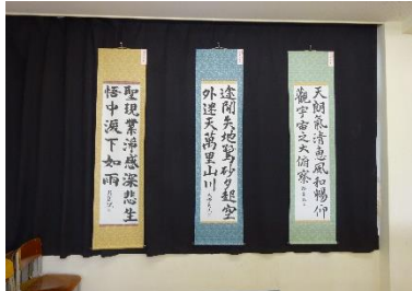
書道部の生徒作品 2年選択書道の生徒作品 (2階選択教室)