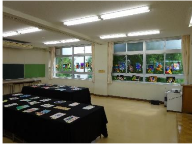
2年選択美術の生徒作品 (3階選択教室)